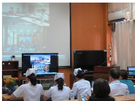
チョーライ病院でのカンファレンスの様子