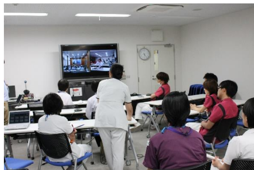
筑波大学附属病院でのカンファレンスの様子