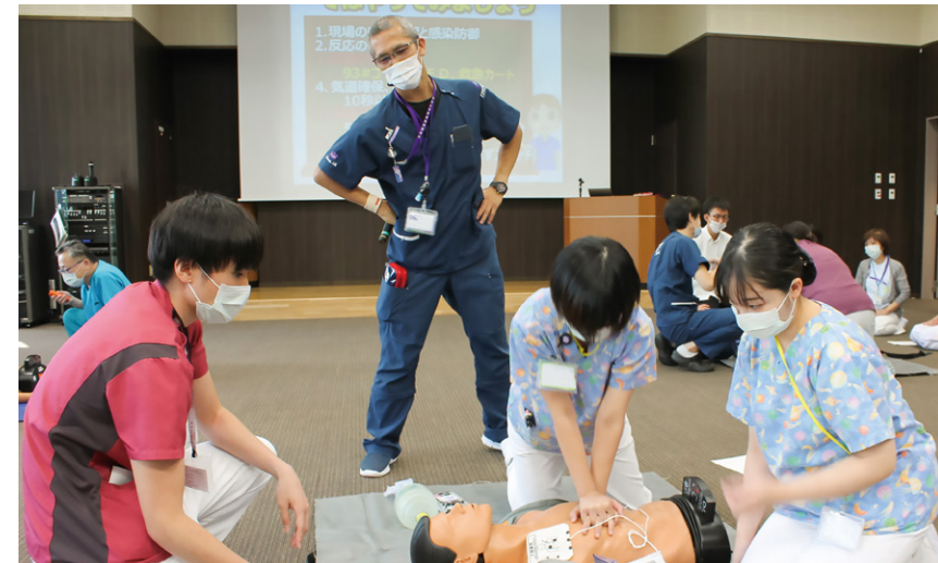
院内蘇生講習会（AED講習会）： 救急集中治療部の医師や認定看護師により指導が行われます。

“チーム医療”ってよく聞くけど、ここではそれが本当に実行されているんだなと実感します。多職種との連携も、垣根が低いっていうか、「協働」という言葉がぴったりくるんです。