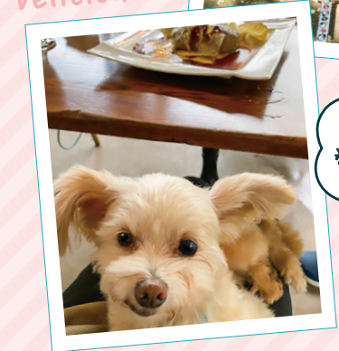
愛犬との 癒しの時間♡

オフタイムの楽しみは、何と言っても愛犬とのデート。ペットOKのショップに出かけたり、緑豊かなドッグランで愛犬と思いっきり遊んだり。公園の散歩で自然に癒されたあとに、ドッグカフェで愛犬と食べるスイーツは最高です！四季それぞれの時間がゆっくり流れるつくばの街が気に入ってます。