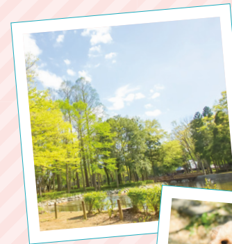
お気に入りの 洞峰公園