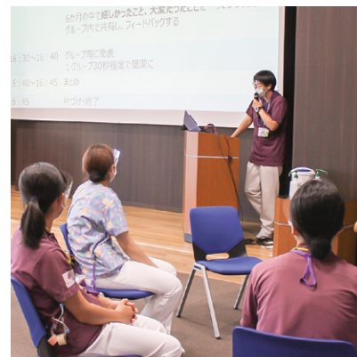
新人看護職員研修（リフレクション研修）： 他の病棟の同期と話をすることでリフレッシュ！貴重な情報共有の時間になります。