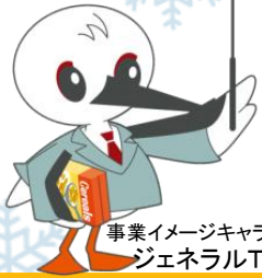
事業イメージキャラクター ジェネラルT先生