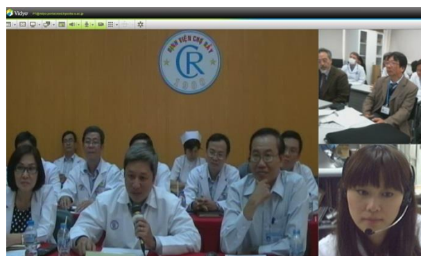
モニタに映し出される3地点。左はチョーライ病院。