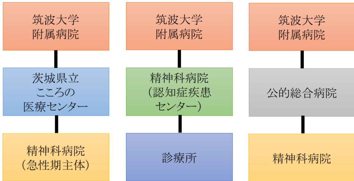
パターンA 精神科救急

自身のサブスペシャリティとしたいことを意識したローテーションが可能である。ローテーションの順番は変更もあり得る