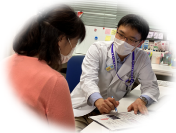
治療の説明、照射中の診察 治療後のフォロー