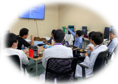
レジデントによる勉強会

初期研修の2年間ではすべての密を達成するのは難しいと思います。まずは放射線腫瘍科の説明会に参加することが大切です。小児から高齢者、緩和治療から根治治療、臓器を問わずがんに向かう仲間を募集中です。