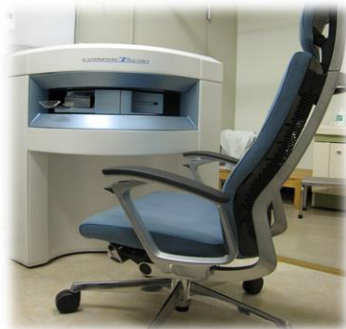
手専用コンパクトMRI