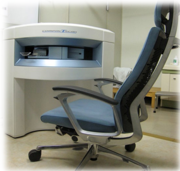
手専用コンパクトMRI