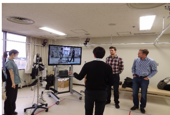
BOA TECHNOLOGY INC.様の見学の様子