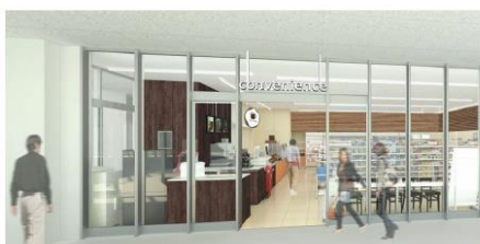
コンビニエンスストア