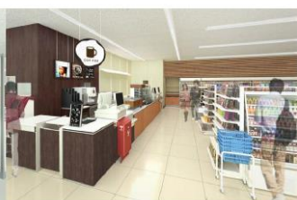
コンビニエンスストア (内観)