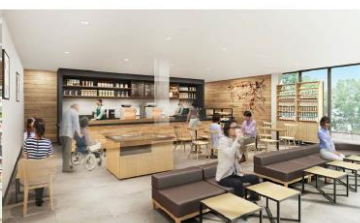
コーヒーショップ