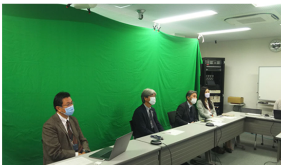
本院・本学代表者（手前から：小田副病院長/平松副病院長/大根田国際室室長/ 福重助教）