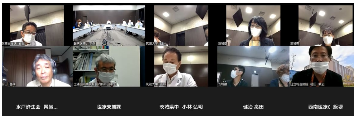
オンライン会議風景