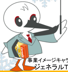
事業イメージキャラクター ジェネラルT先生